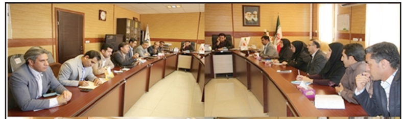
دانشگاه علوم پزشکی ایلام برگزار شد. به گزارش خبرنگار وب دا، در ابتدای این جلسه سرپرست دانشگاه علوم پزشکی ایلام ضمن خیر